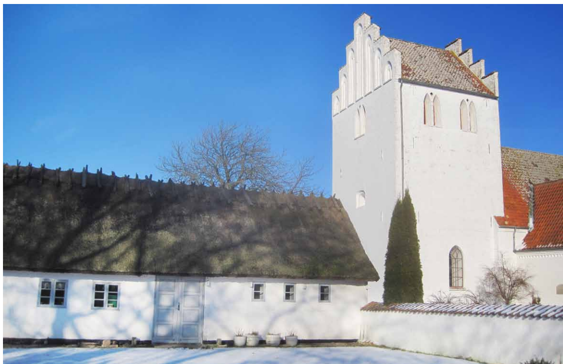
Legathuset i Alsted ved Fjenneslev, set fra haven. Til højre ses noget af sognekirken og kirkegårdsmuren, vigtige elementer i det samlede, historiske kulturmiljø i Alsted.

varierende bredde bidrager til indtrykket af en ældre, ydmyg længebygning. En bygning, som har formået at bevare sin hovedform og prunkløse udtryk trods flere ombygninger.