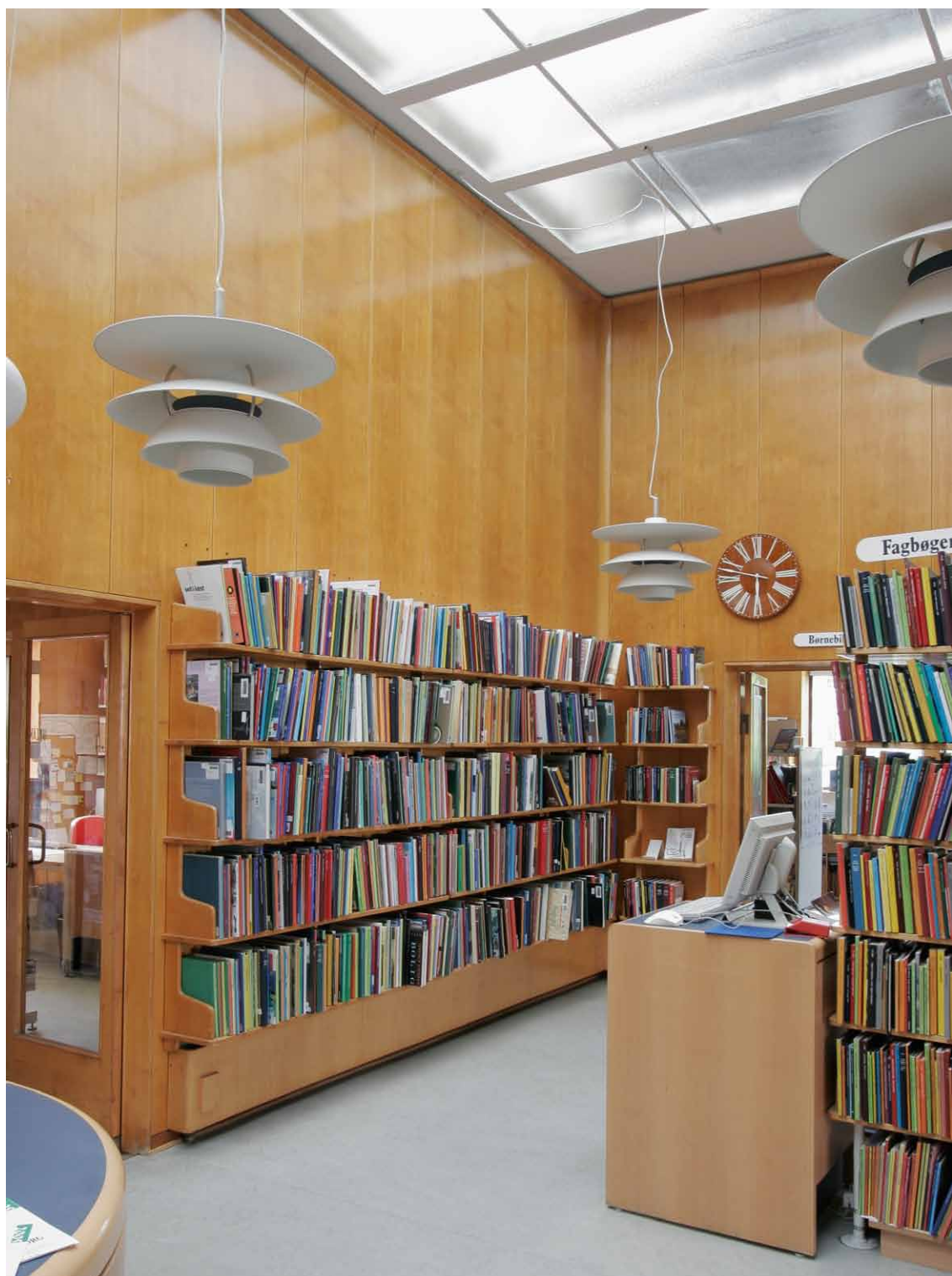
Arkitektoniske værker fremstår i bedste fald med en stor grad af bearbejdning ned til mindste detalje. Her ses Nyborg Biblioteks velbevarede interiør med ahornfineret vægbeklædning og reoler af Hans J. Wegner.