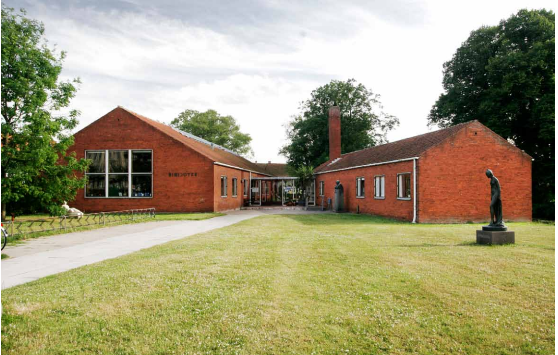
Nyborg Bibliotek, der er opført i 1938-39 efter tegninger af Flemming Lassen og Erik Møller, er et godt eksempel på et arkitektonisk værk, som er skabt ud fra en samlet kunstnerisk idé.

blev købt af menighedsrådet i 1970 og lagt under kirkeembedet. Men bygningens historie går tilbage til 1690, hvor det kaldtes Præstehuset, fordi det dengang blev ejet af præsteembedet. Fra 1768 til 1816 blev det beboet af sognets præsteenker og kaldtes Enkesædet, men i 1843 blev det købt af ejeren på Alstedgården. Hans søn oprettede i 1890 et legat, så huset blev fribolig for trængende i Alsted Sogn, og sådan fungerede det til omkring 1950. Huset hedder fortsat Legathuset, men rummer i dag kirkens toiletter, redskabsrum, frokoststue m.m. til graveren, køkken og mødelokale.